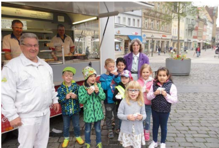
Besuch auf dem Coburger Wochenmarkt