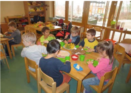
Gemeinsam wird ein abwechslungsreiches und gesundes Frühstück zubereitet

Im letzten Kontakt-Heft konnten Sie einiges über unser neues Frühstücksprojekt lesen. Seit Januar bereiten wir täglich mit den Kindern ein abwechslungsreiches gesundes Frühstück und eine Vesper zu. Von den Kindern wird dies sehr gut angenommen. Viele finden es toll, dass sie etwas mit vorbereiten und ihr Brot selbst streichen können. Zusätzlich zu den frischen Zutaten, die wir einkaufen werden wir noch mit Obst, Gemüse und Milchprodukten vom Biohof kostenfrei beliefert. Dies ist durch ein staatlich gestütztes Schulobst- und Milchprogramm möglich. Da wir auch von den Eltern zahlreiche positive Rückmeldungen hatten, werden wir die tägliche Frühstückszubereitung dauerhaft in unsere Konzeption aufnehmen.